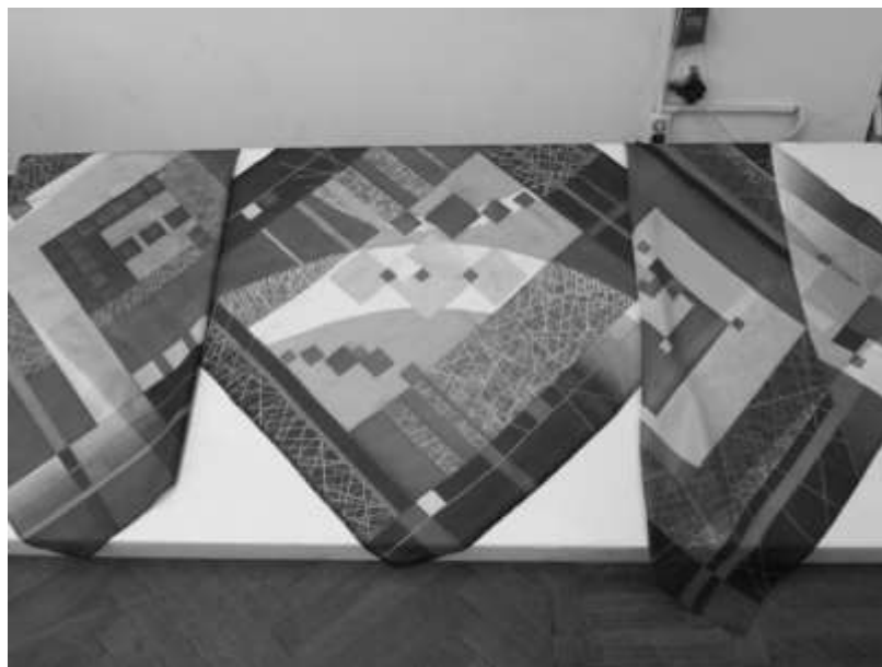
3.2.3 Пример полного объема практического задания, Раздел 4. Выполнение арт-объекта на основе синтеза материалов и технологий (экзамена) в 4 семестре